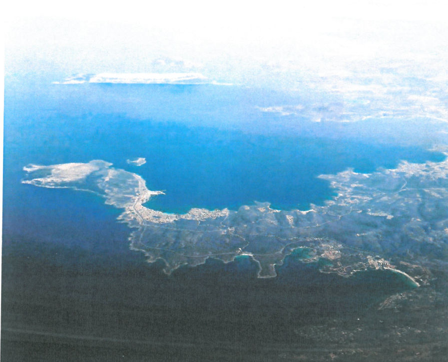
Sardinia de sus

Privind pe gemuletele avionului ne-am dat seama ca am facut alegerea buna, cu siguranta.