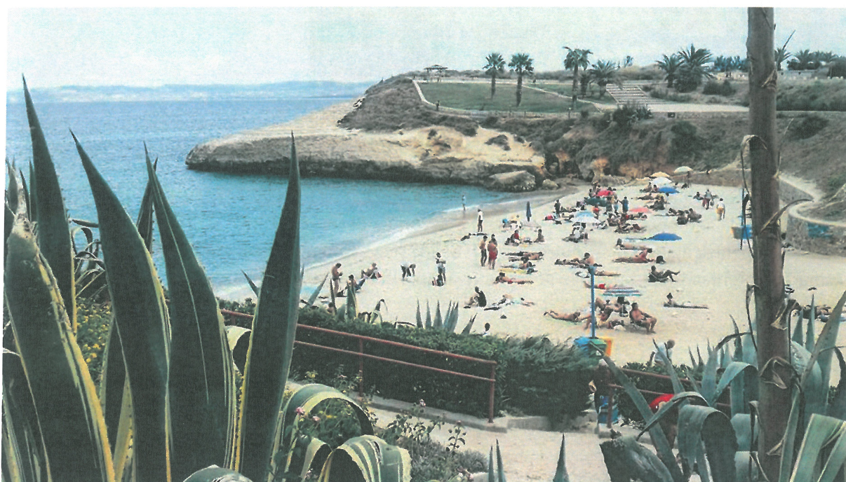
Primele poze facute pe plaja din Porto Torres (in jur de 20 de km distanta de oras)