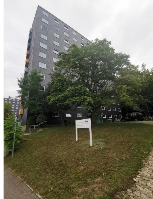
MAX KADE Haus