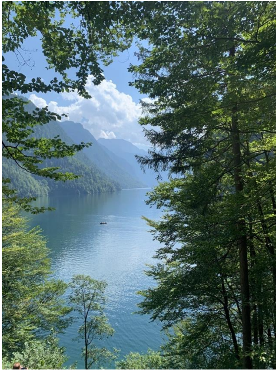
Königsee , Germania