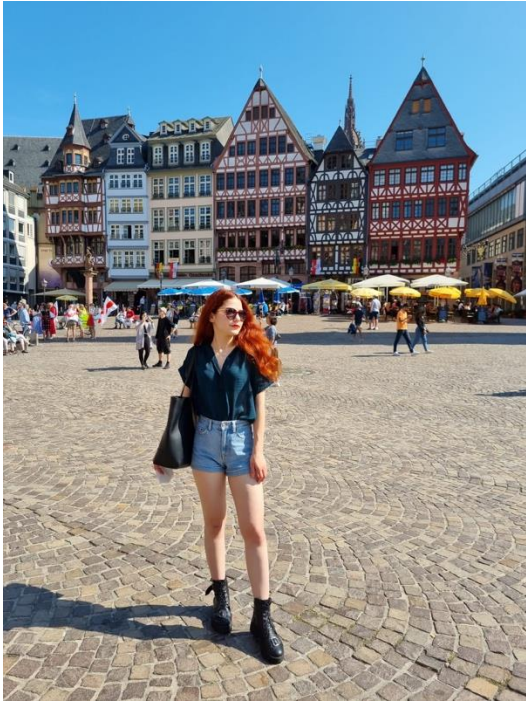
Frankfurt am Main