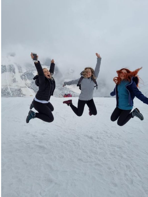
Hintertux Glacier, 3250m Austria