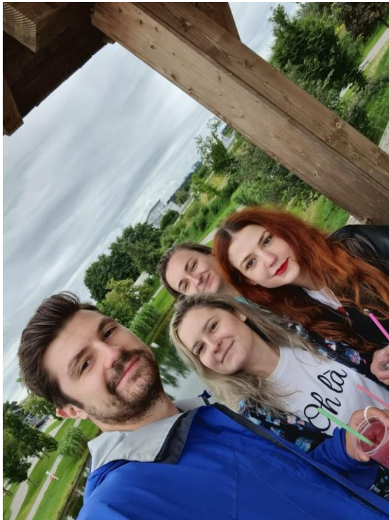
Skyline Park, Germania