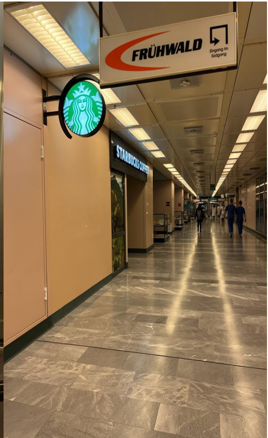
interiorul spitalului AKH