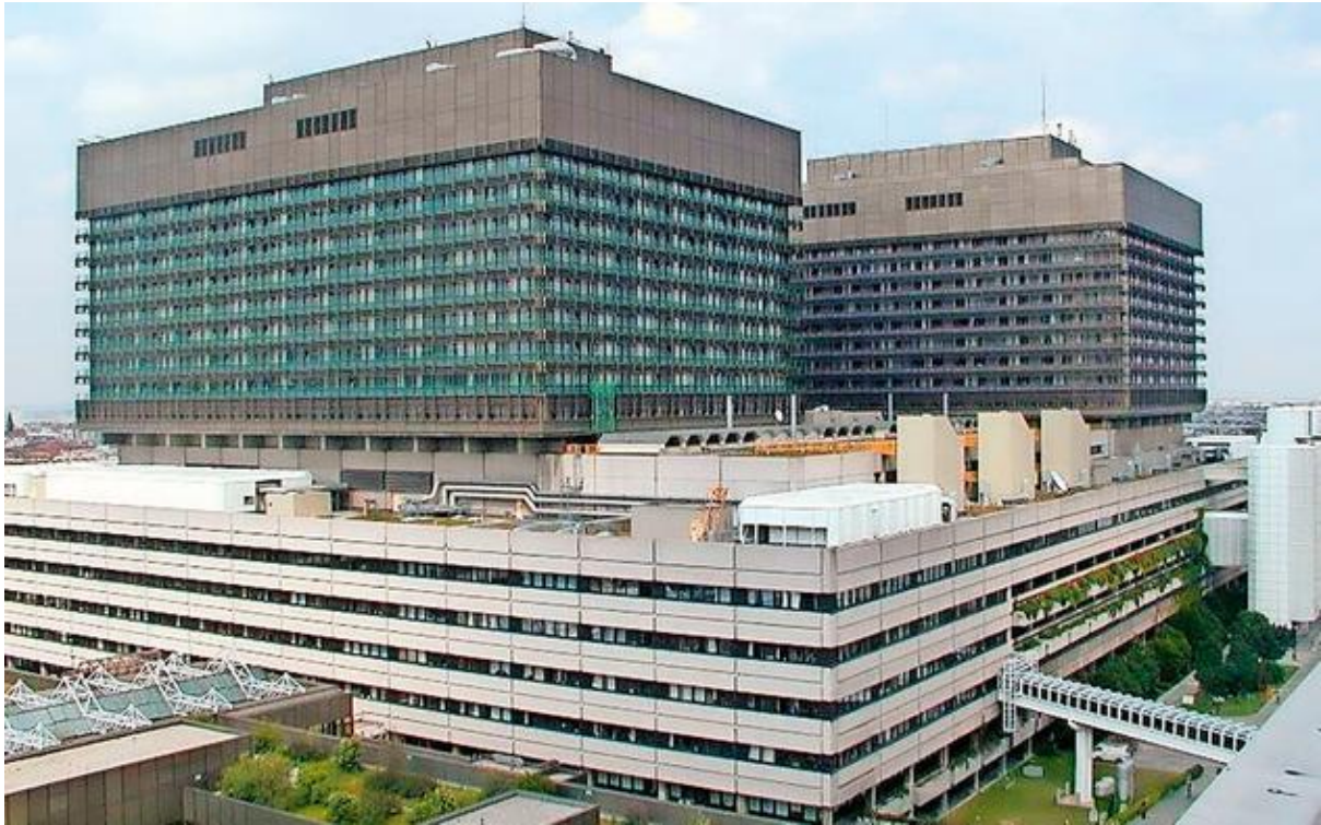
Allgemeines Krankenhaus der Stadt Wien

mai mult cazuri clinice, online sau onsite in functie de materie. Eu cursurile le-am prins toate exclusiv online, modul de predare a ultimelor doua fiind o consecinta a pandemiei, s-ar putea sa nu fie definitiv.