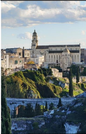
GRAVINA in PUGLIA