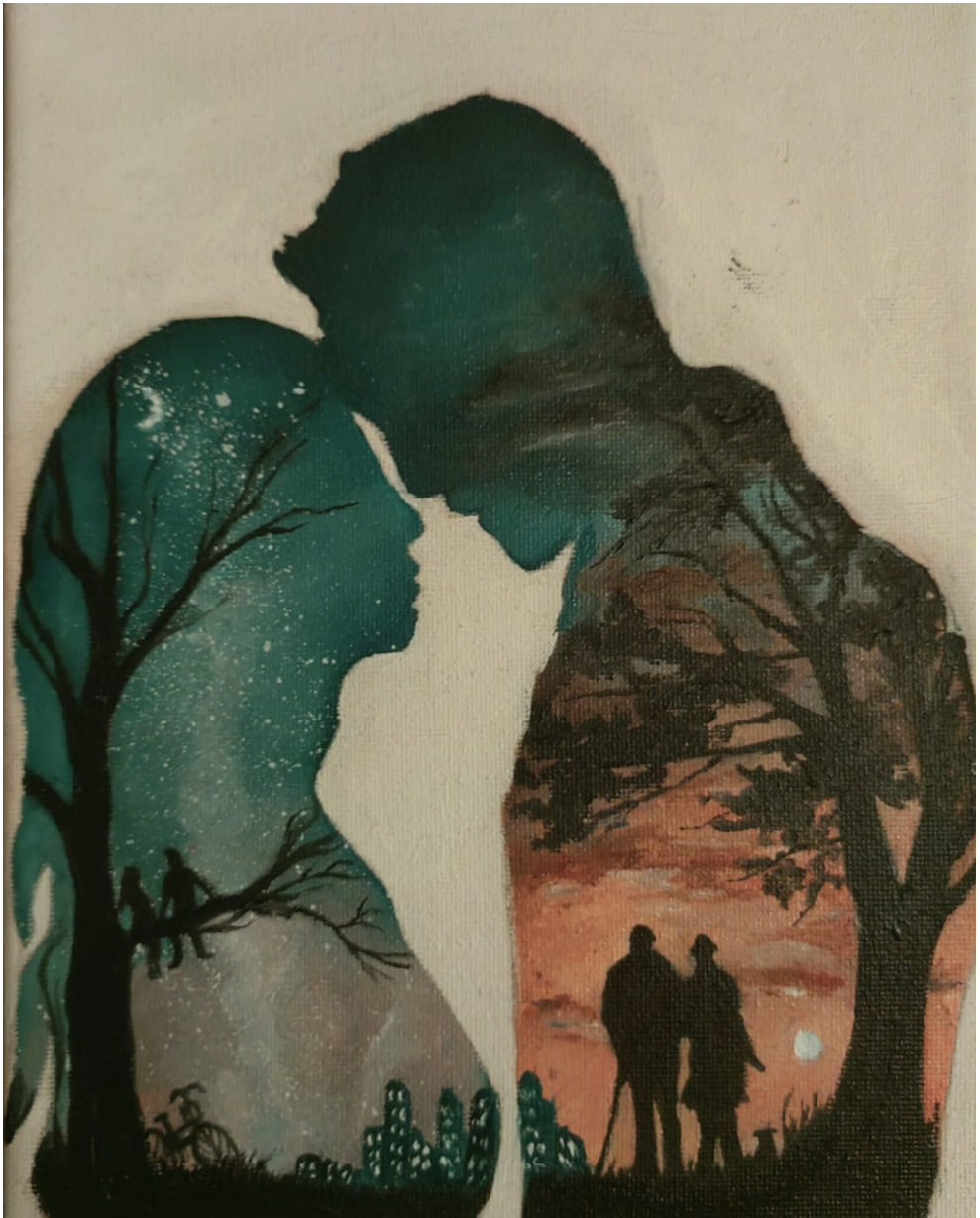
Manuela Narcisa POPESCU : Watching through windows