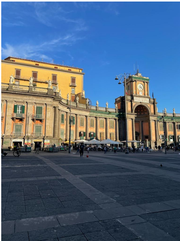
Piazza Dante, Napoli