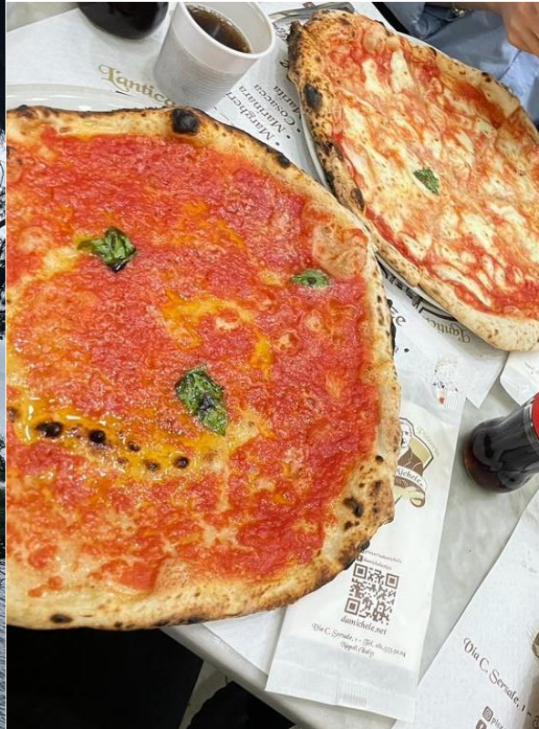
L'Antica Pizzeria da Michele, Napoli