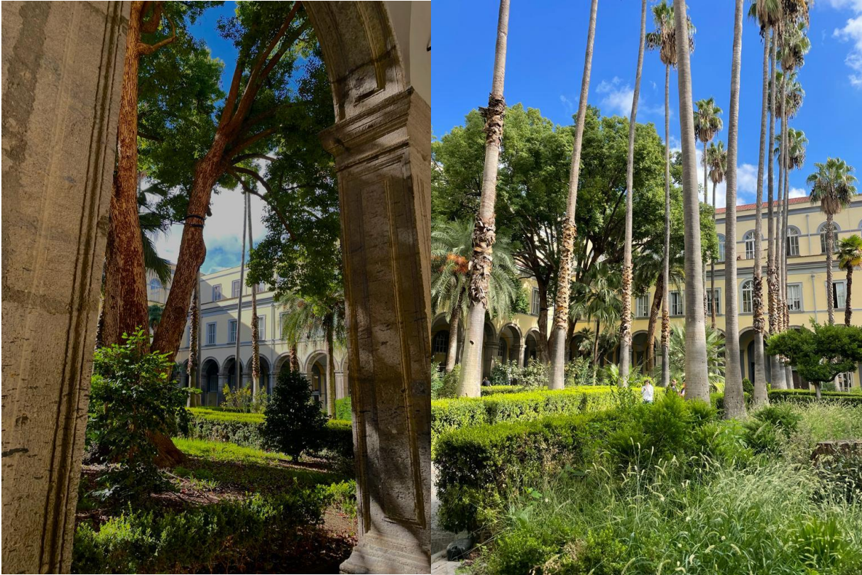
Curtea Universității din Napoli

Grupurile de pe facebook sau whatsapp sunt cei mai buni prieteni ai tăi deoarece de acolo afli majoritatea lucrurilor de la mersul autobuzelor sau greva acestora, până la orar, excursii, petreceri și chiar cazări sau posibilități de voluntariat.