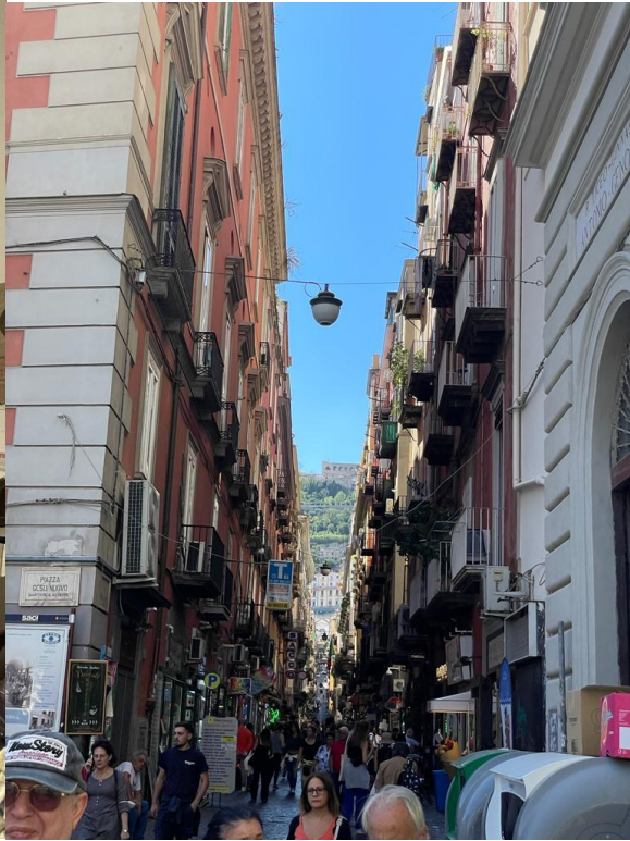
Centro storico, Napoli