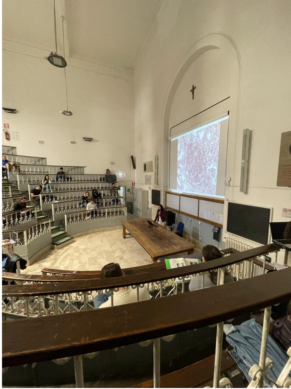
Sală de clasă